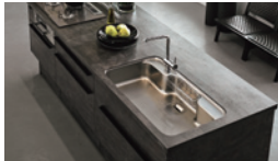
調理が楽しいキッチン