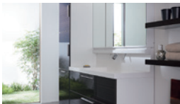
収納たっぷりの洗面台