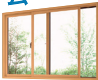
商品画像はイメージです。

工事総額 300,000円 (内窓本体・取替工事・廃棄費用の目安、消費税込)を想定、オールLIXIL 無金利リフォームローンキャンペーン適用、頭金0円、割賦元金 300,000円、60回均等払いを想定した試算金額となります。実際の金額とは異なりますので、詳細につきましてはお尋ねください。