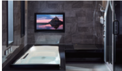
ゆったりできる浴室